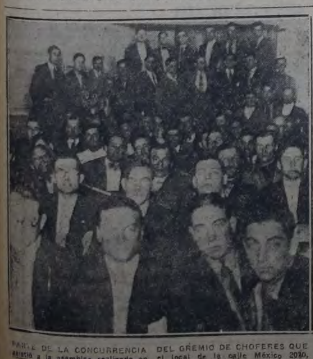
PARTE DE LA CONCURRENCIA DEL GREMIO DE CHOFERES QUE asistió a la asamblea realizada en el local de la calle México 2020.

ACUACION DE PICHAS Y ESTAMPADOS CHAPITAS PARA LA RECLAMA 537 VICTORIA - SARMIENTO 825 BUENOS AIRES PIDANSE CATALOGOS